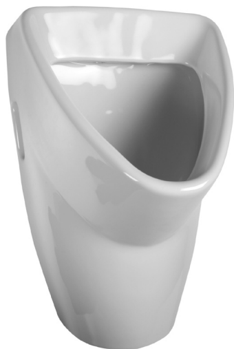
SLP 31 - LIVO