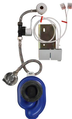
Схема включения и монтажа