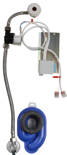
Схема включения и монтажа