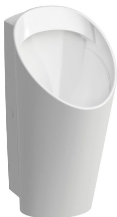
SLP 59 - LEMA RIMLESS