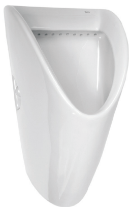
SLP 27 - CHIC