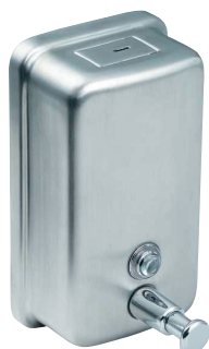
SLZN 05 95050 Нержавеющий дозатор жидкого мыла