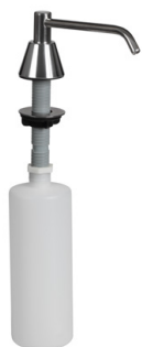
SLZN 17 95170 Встроенный дозатор жидкого мыла