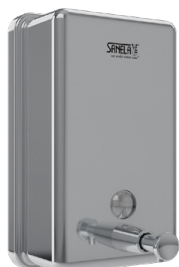
SLZN 39A 95391 Нержавеющий дозатор жидкого мыла