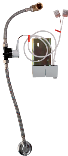
Схема включения и монтажа