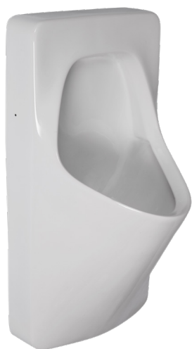
SLP 20 - ANTERO