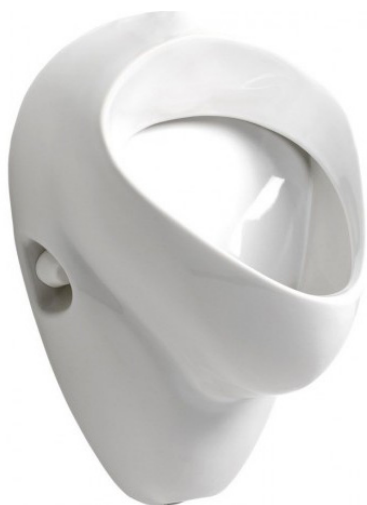
SLP 07 - NOVA PRO FELIX