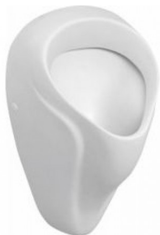
SLP 18 - NOVA PRO ALEX