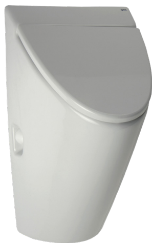
SLP 32 - ARQ С КРЫШКОЙ