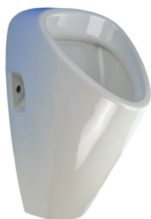
SLP 19 - GOLEM