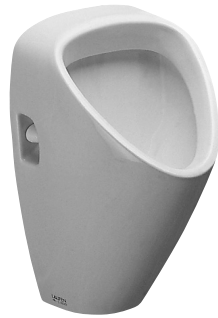
SLP 23 - CAPRINO