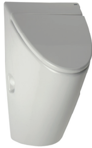
SLP 32 - ARQ С КРЫШКОЙ