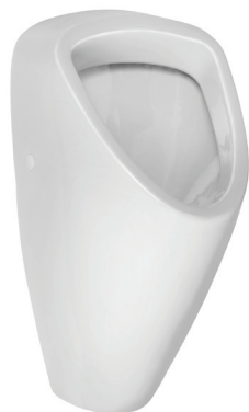
SLP 49 - CAPRINO PLUS