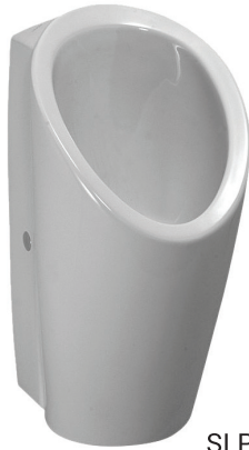
SLP 59 - LEMA