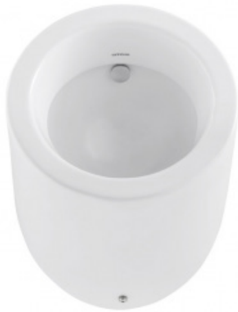
SLP 82 - WCA - Sanindusa