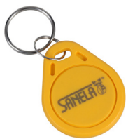
1 шт. из 50 шт. жетонов SLZA 51